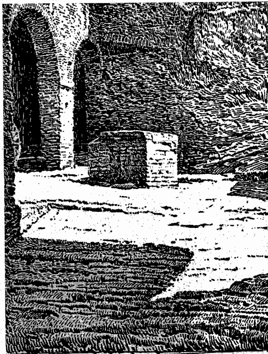
A. VILIGIARDI - Il Pozzo della Diana