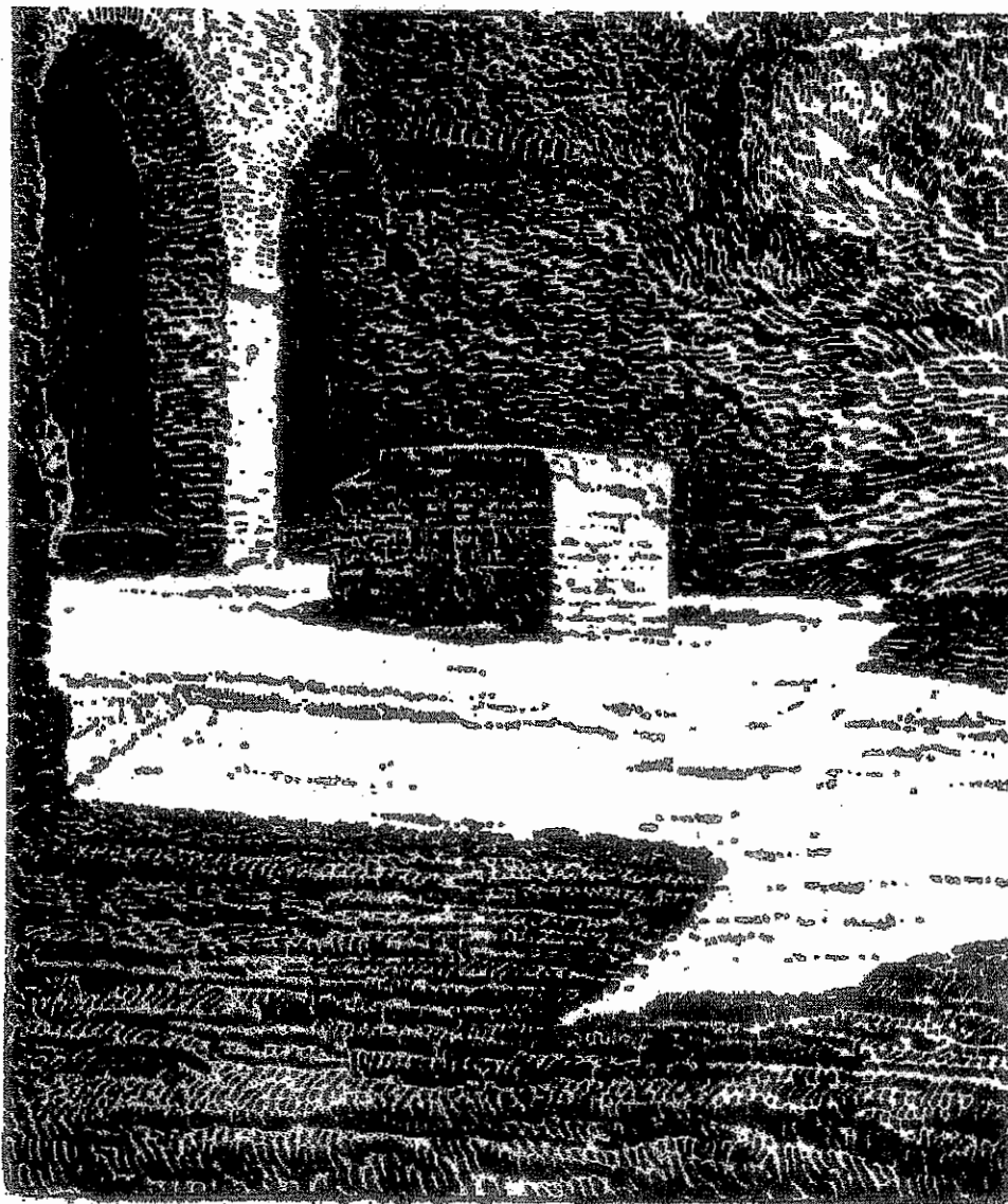
A. VILIGIARDI - Il Pozzo della Diana